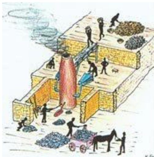
Κάμιнос τήξης μεταλλεύματος. (Αναπαράσταση: Κ. Κονοφάγος.)

8 κοντά... στις πιο πολλές από τις άλλες πόλεις ... προβλήματα: Δεν εννοεί οι πιο πολλές από όλες τις πόλεις γενικά αλλά από τις πόλεις που ήταν σημαντικοί εμπορικοί σταθμοί, ενδεχομένως ανταγωνιστικοί προς την Αθήνα (π.χ. το Βυζάντιο). Η απουσία αντιθέσεων με τους γείτονες βοηθάει την ανάπτυξη ειρηνικών δραστηριοτήτων, όπως είναι το εμπόριο.