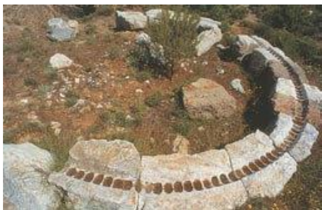
Ελικοειδές πλυντήριο του 4ου αι. π.Χ. για τον καθαρισμό του μεταλλεύματος (Λαύριο).

7 Και παρά το γεγονός ότι δεν βρέχεται ολόγυρα από θάλασσα, σαν να ήταν νησί, και εισάγει από όλα τα σημεία του ορίζοντα ό,τι χρειάζεται και εξάγει ό,τι επιθυμεί·