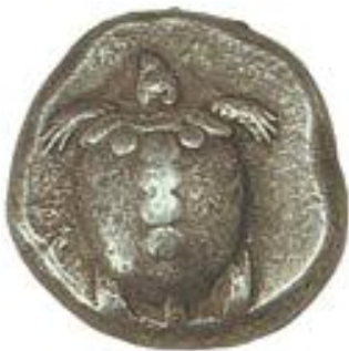
Στατήρας από την Αίγινα, αρχές 5ου αι. π.Χ. (Αθήνα, Νομισματικό

β) Να υποδείξετε ένα σημείο του κειμένου όπου η εξιστόρηση των γεγονότων δεν φαίνεται ιδιαίτερα πειστική – είναι μάλλον αδύνατο τα πράγματα να έγιναν έτσι όπως περιγράφονται.