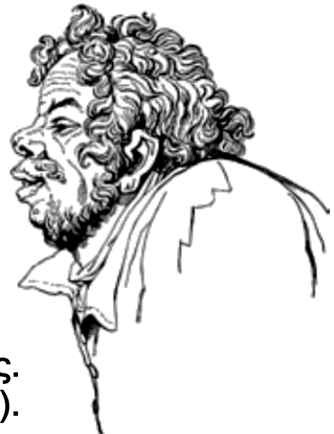
Ο ἄγροικος. Σκίτσο του I. Taylor (1824).

Ἄγροικος σημαίνει αρχικά «αυτός που κατοικεί στους αγρούς», αργότερα «αυτός που φέρεται όπως οι άνθρωποι που κατοικούν στους αγρούς», «αυτός που δεν έχει τρόπους». (Ο άνθρωπος που ξέρει να φέρεται, που έχει τρόπους, ονομάζεται στην αρχαιότητα άστεϊος – κυριολεκτικά το άστεϊος σημαίνει «ο άνθρωπος της πόλης, του ἄστεως», αλλά δεν χρησιμοποιείται με την κυριολεκτική σημασία). Ο τύπος του ἄγροίκου είναι γνωστός κυρίως από την κωμωδία του 4ου αιώνα. Οι κωμικοί ποιητές της εποχής Αντιφάνης και Αναξανδρίδης έχουν γράψει κωμωδίες με τίτλο Ἄγροικος και Ἄγροικοι.