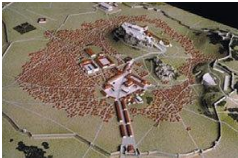
Η Ακρόπολη και ο χώρος γύρω από αυτή. (Μακέτα των Ι. Τραυλού-Δ. Ζιρώ.)