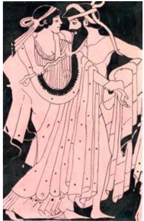
Εταίρα και κωμαστής. [Αντιγραφή: Στ. Μπονάτσος]