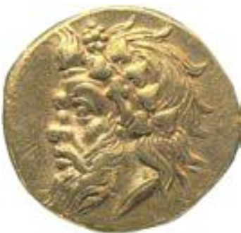
Χρυσός στατήρας από το Παντικάπαιον, 4ος αι. π.Χ. (Αθήνα, Νομισματικό Μουσείο.)