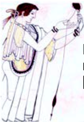
Γυναίκα που γνέθει. Αθηναϊκή Οινοχόη, περ. 490-480 π.Χ. [Αντιγραφή: Στ. Μπονάτσος]

7 «Στα υπόλοιπα,» είπα εγώ, «εκπαίδευσες, Ισχύμαχε, εσύ ο ίδιος τη γυναίκα σου, ώστε να είναι